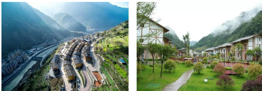
组图二：美丽乡村项目雪山村（左）、邓池沟（右）

在宝兴县穆坪镇雪山村开展美丽乡村项目，项目主要对村庄规划、建筑方案设计，农房重建补助、村庄公共建筑（知青房、村民活动中心、村庄老人儿童文化中心）、合作社的产业发展（特色民宿旅游和特色餐饮）以及合作社能力培训等方面进行支持；在宝兴县蜂桶寨乡邓池沟（青坪村、和平村）开展美丽乡村项目，项目主要对村庄规划、建筑方案设计、农房重建补助，村庄公共建筑（“熊猫之家”文化中心、民俗文化活动中心）合作社能力培训等方面进行支持。