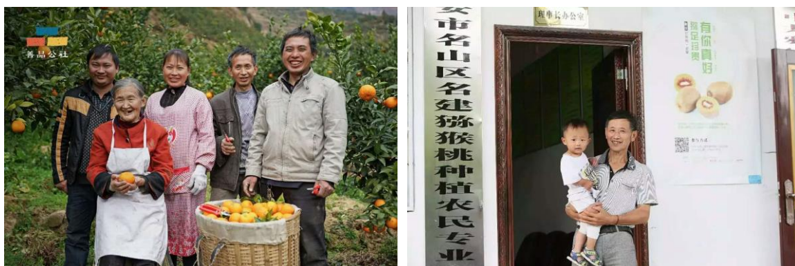
组图四：电商扶贫项目