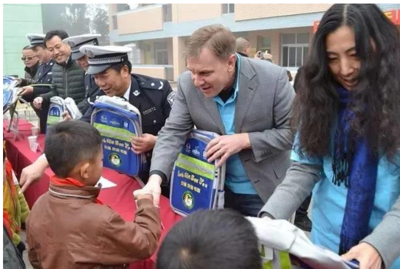
图六：安全书包发放现场

我会在天全县 15 所学校、芦山县 13 所学校、名山区 3 所学校发放交通安全书包，受益学生 1.5 万人。