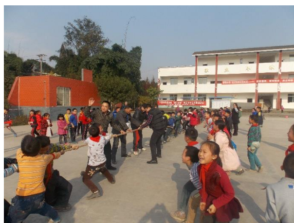
组图十：加油计划活动现场