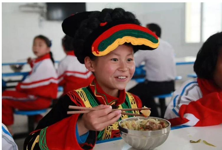
图一：爱心厨房项目

2013 年 11 月到 2014 年 9 月，中国扶贫基金会在雅安实施“爱心厨房”项目，资金投入共计 714.94 万元，该项目在雅安地区的汉源县、雨城区 48 所学校为 1.53 万学生提供爱心厨房设备，保证这些学校的学生能够享有营养、可口的热餐。