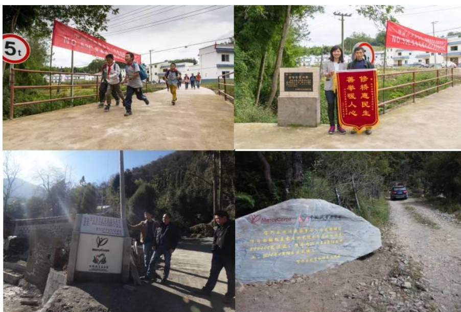
组图六：小微基础设施项目照片