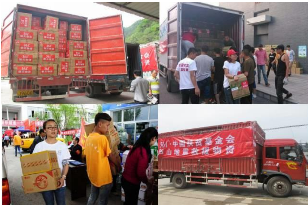
组图一：紧急救援项目物资发放现场