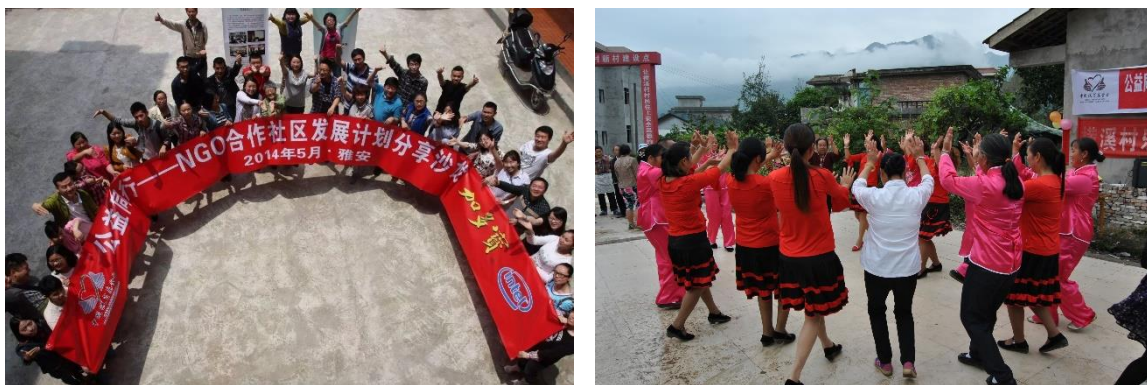
组图八：公益同行—NGO合作社区发展计划分享沙龙

2013年芦山地震后,我会支持13家NGO针对灾后过渡安置开展社区陪伴项目,缓解受灾人群紧张情绪,恢复社区关系和社区正常生活。2014年开始,从社区项目支持、社区成长陪伴、社区人才培养三个层面系统性支持16家NGO从生计发展、社区服务两个领域,激发社区活力,推动社区发展。2016年芦山公益同行进入项目实施的第三个周期,中国扶贫基金会进一步优化项目模型,以项目支持为核心,资助9个项目,并进行日常监测、月度督导及跟踪调研等工作。