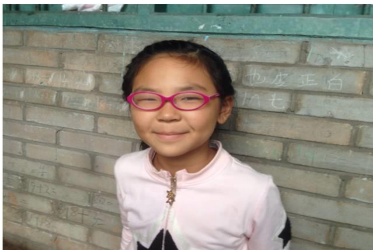
图二：助明计划项目

项目为雅安市宝兴县、汉源县、芦山县和雨城区的妇幼保健院提供小儿眼科检查设备，对以上 4 县区 3-7 岁儿童进行视力筛查、并对筛查出眼疾的儿童进行配镜、矫正及手术补贴；同时在当地开展验光师培训和小儿眼科疾病相关知识培训。