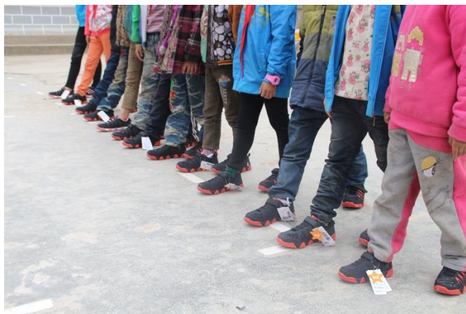
图七：买一善一项目鞋子发放

者每购买一件 361° 指定的公益专款鞋，就同步以消费者名义向受捐赠的贫困小学生捐出一双适合其尺码的鞋子。我会通过买一善一项目向芦山县芦山初级中学、国张中学共 2075 名中学生发放鞋子。