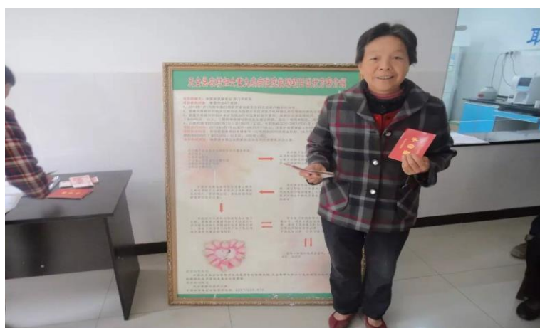
图三：天全县妇女大病项目

妇女大病项目于 2013 年 5 月在天全县开始实施，并于 2014 年 6 月实施完毕。项目为雅安市天全县符合救助条件的患重大疾病农村妇女提供现金补助，项目累计救助 150 名天全农村身患大病的妇女。