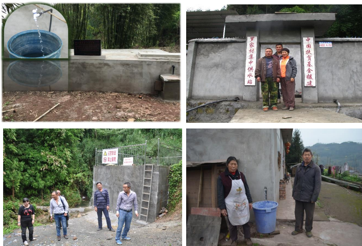
组图五：人畜饮水项目

我会在宝兴县、天全县、芦山县、汉源县、石棉县等地建设 20 个人畜饮水项目，受益村民 27864 人。