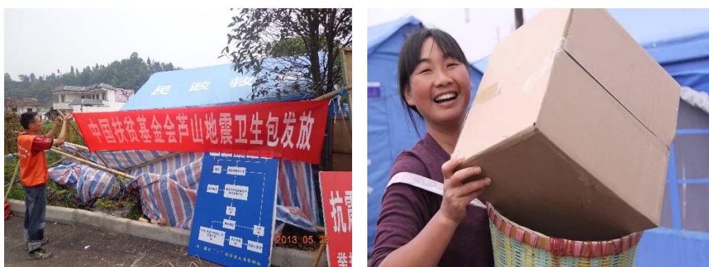
组图九：卫生包领取

芦山地震发生后，为防止疾病发生于传染，我会向雅安市天全县、芦山县、宝兴县和雨城区采购并发放 26087 个卫生包。