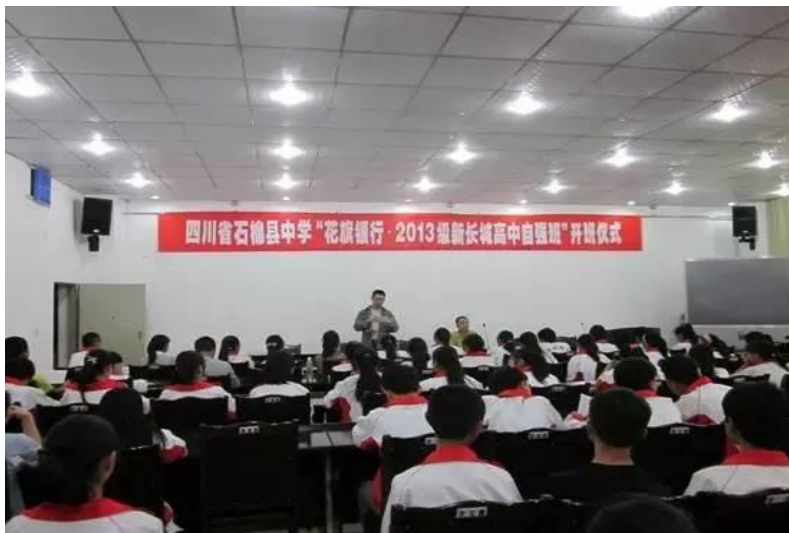
图四：高中生自强班开班仪式

我会在四川省名山中学、石棉中学建立两个“花旗银行·新长城自强班”，每班 68 名，共 136 名贫困学生。本项目对 136 名贫困学校进行连续三年的资助。