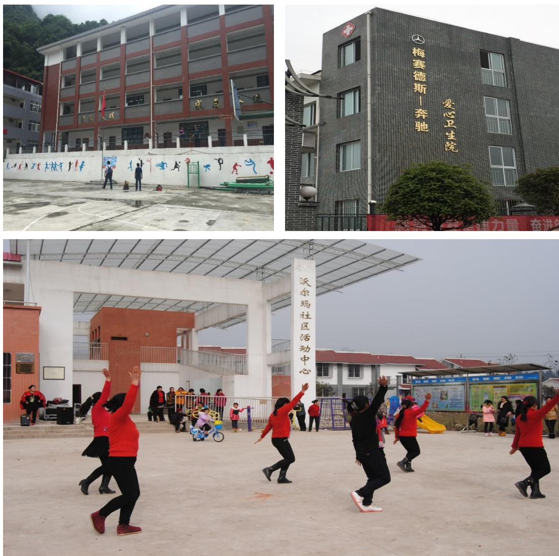
组图三：社区发展类项目，学校（左上）、卫生院（右上）、活动中心（下）

在汉源县、名山区、石棉县实施电商扶贫项目，开展车厘子、猕猴桃、黄果柑推广活动并实现交易额 3829.65 万元，为种植农户人均直接增收 700 元，总体上，通过合作社组织培育、生产资料补贴及产品营销推广等方式累计支持受益农户约 1 万人。