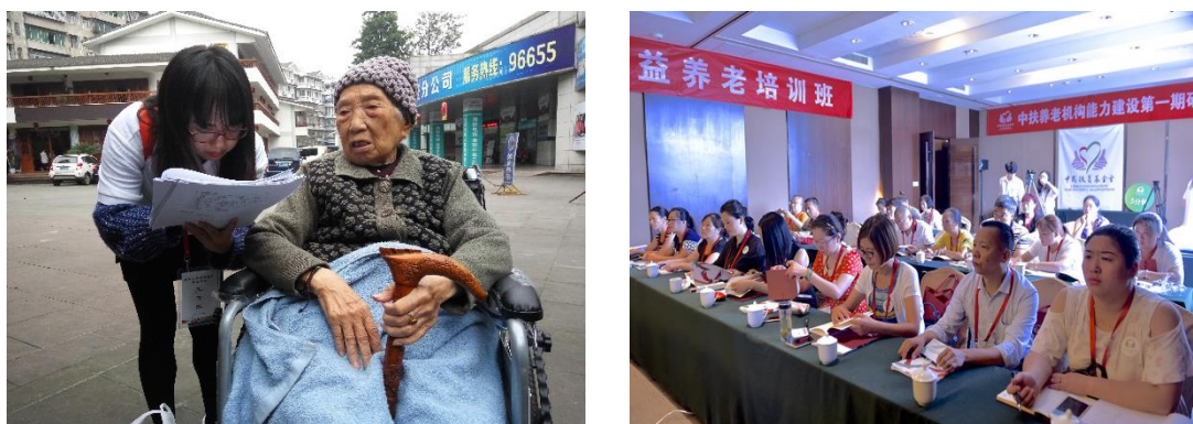
组图七：养老项目调研及培训