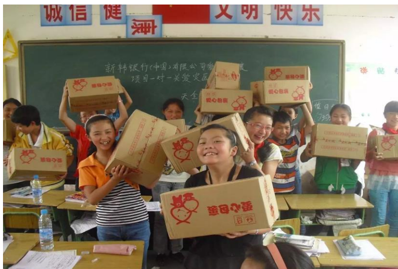
图五：爱心包裹发放现场

我会向芦山县、宝兴县、天全县三个重灾区 11870 名小学生发放了 11870 个学生型美术包和 10050 个学生型生活包；向芦山县、宝兴县的 9 所学校发放 27 个学校型体育包和 14 个学校型音乐包；向芦山县、宝兴县、天全县的 6000 名教师发放了灾区教师关爱包。