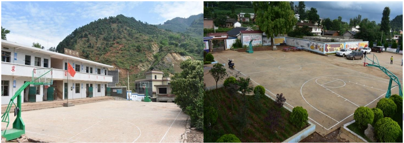
图1|汤朗小学阳光操场

阳光操场修建 ：4月10日，新田小学、田坝小学、汤朗小学、水营小学4所学校阳光操场开始动工。6月29日，由威宁县教育局领导、加油计划威宁办公室工作人员、学校代表对阳光操场进行验收。