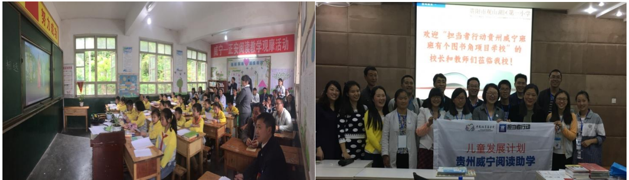
图1|正安阅读教学观摩

2016年，项目为11所项目学校修建了阅读空间，每个班级都有1个图书角，为了让图书角能被高效利用，培养学生的阅读习惯。5月21日至27日，项目组织12名教师参加了贵阳及遵义的阅读研习活动。