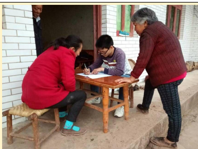
安岳县雷坡村童伴妈妈入户走访