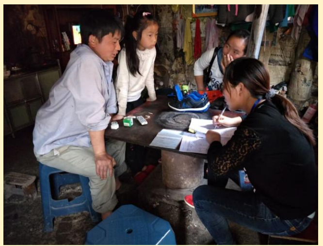
童伴妈妈们在进行基线调研入户走访