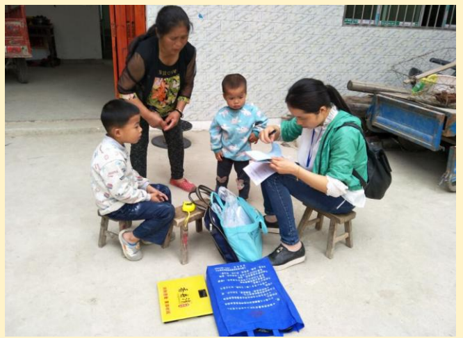
童伴妈妈们在进行基线调研入户走访