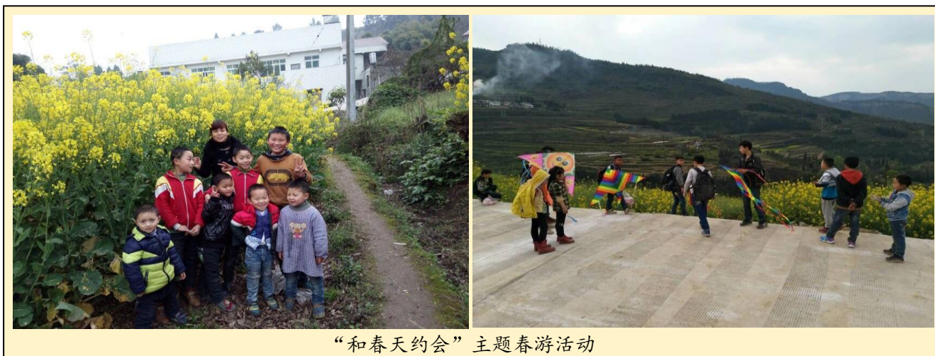
“和春天约会”主题春游活动