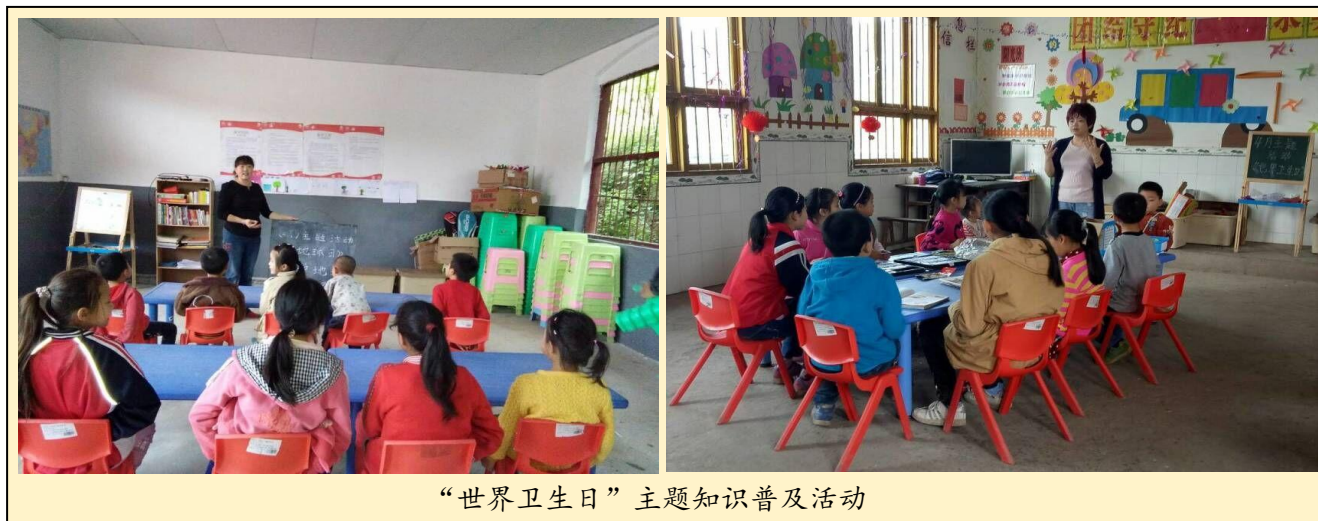
“世界卫生日”主题知识普及活动