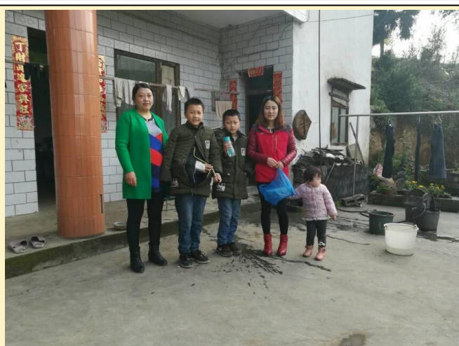
叙永县三台村童伴妈妈入户走访