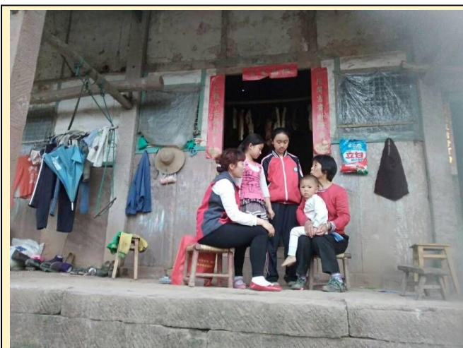
安岳县钟坡村童伴妈妈入户走访

童伴妈妈们每个月都会对困境儿童、留守儿童等重点关注对象进行家访，即使天气不好，道路泥泞不堪，她们也不会推脱和畏缩。春节期间，童伴妈妈主要与孩子和主要照料人沟通交流，教会家长与孩子沟通的技巧和方法，促进亲子沟通；并及时了解孩子们在生活、心里上的状况，并针对其在福利、心理需求进行对应的服务，同时更新儿童档案，达到对村中儿童的动态管理。