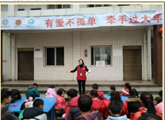
“有爱不孤单，牵手过大年”春节主题活动