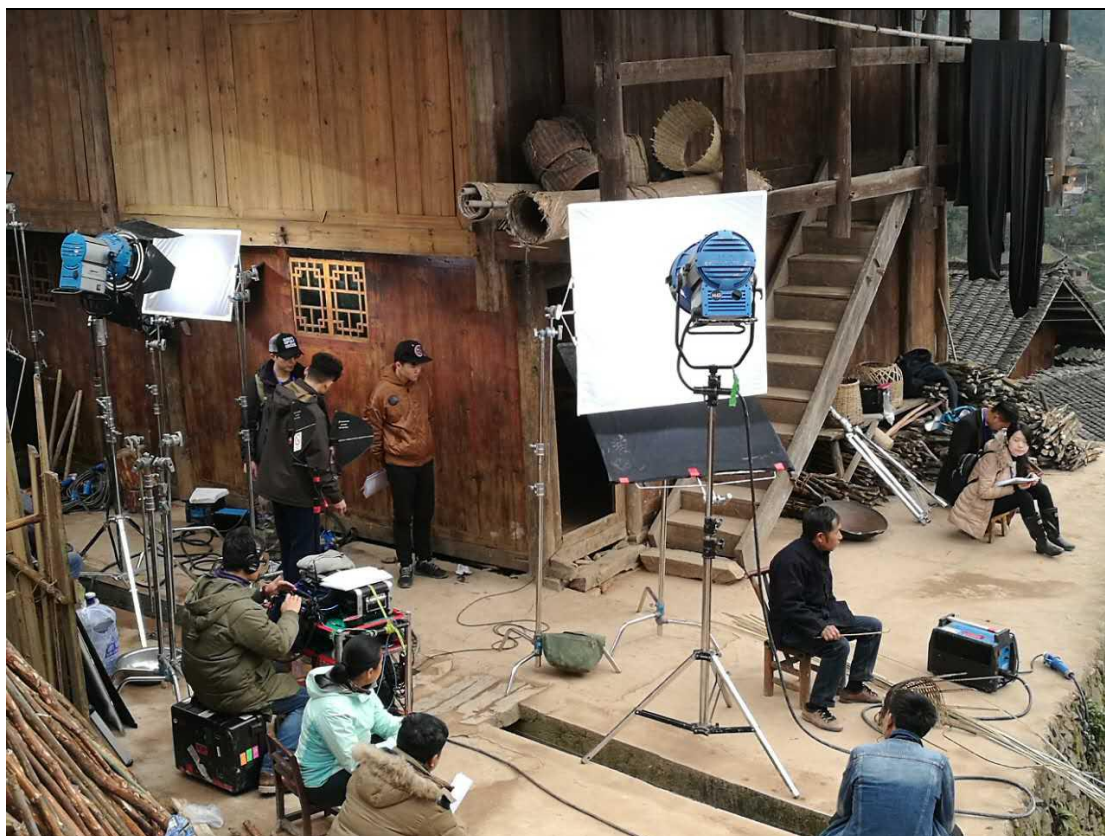
14、3月28日，雪山福民专业社2017年开业启动会在雪山村游客接待中心二楼会议室召开，加入合作社的十位民宿户参与讨论。