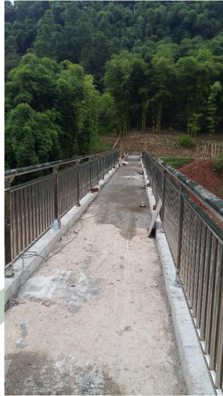
(8) 四川省合江县先滩镇老龙口村溪桥