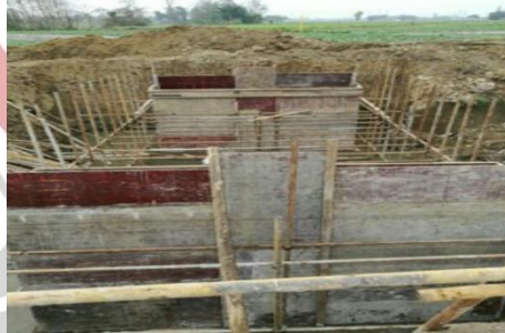
(13) 四川省开江县长岭镇山溪口村小家湾溪桥桥面浇筑