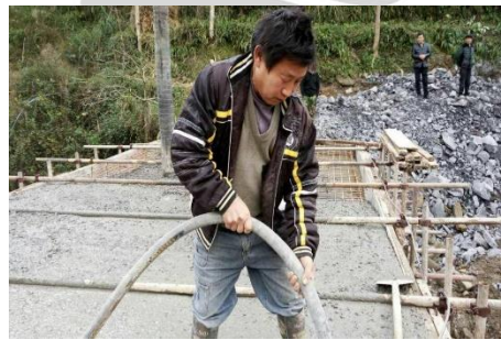
(14) 四川省开江县长岭镇山溪口村水竹林溪桥桥面浇筑