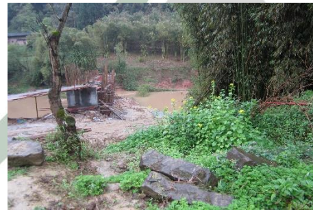
(9) 四川省合江县五通镇石顶山村陈滩溪桥