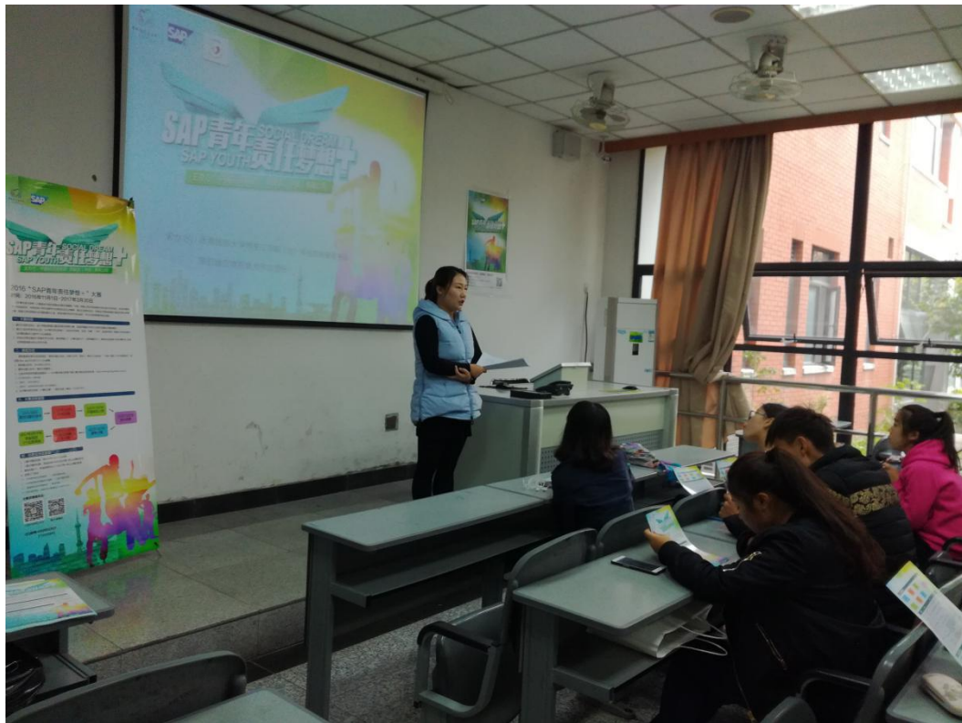
西南民族大学校园宣讲会