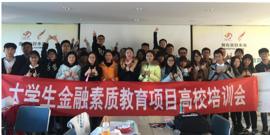
20所高校社团负责人培训会合影

2016年10月30日，来自10个城市的20所高校的39名社团负责人齐聚北京。为期一天半的培训会让各位负责人充分认识了中国扶贫基金会、公益未来项目；对花旗大学生金融素质教育项目产生了更深入的了解，了解项目发起缘由，如何更好的在校开展课程培训及辩论赛；通过小组讨论的形式，同学们集思广益，不仅打开了做项目的思路，同时也提高了同学们的团队管理能力。