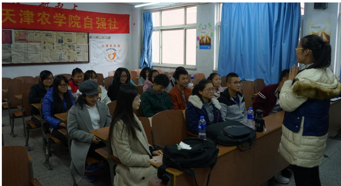
讲师前往项目学校授课