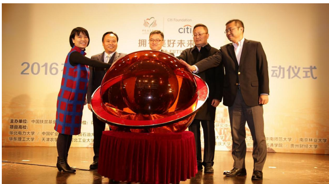
2016花旗大学生金融素质教育项目正式启动

2016年10月30日，来自10个城市的20所高校的39名社团负责人齐聚北京。为期一天半的培训会让各位负责人充分认识了中国扶贫基金会、公益未来项目；对花旗大学生金融素质教育项目产生了更深入的了解，了解项目发起缘由，如何更好的在校开展课程培训及辩论赛；通过小组讨论的形式，同学们集思广益，不仅打开了做项目的思路，同时也提高了同学们的团队管理能力。