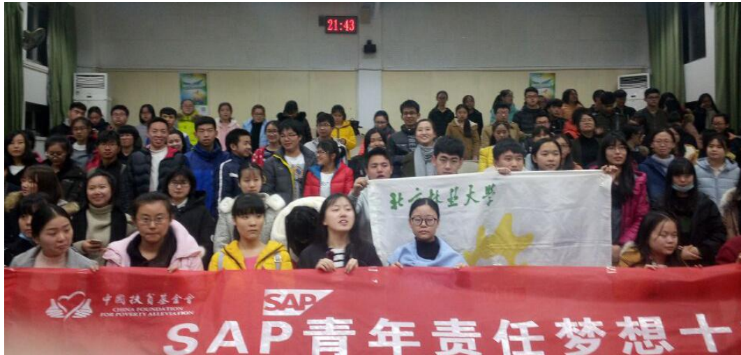
北京林业大学校园宣讲会

经 80 支校园宣传团队大力传播，本项目共收集大赛方案 670 个，组委会对方案进行海选，共计选出 104 份优秀方案进入一轮评审。一轮评审共邀请 5 位专家评委对方案进行评审，产生全国 50 强团队名单。目前 50 强项目已经上线，进入第二阶段的点赞与技术众筹。