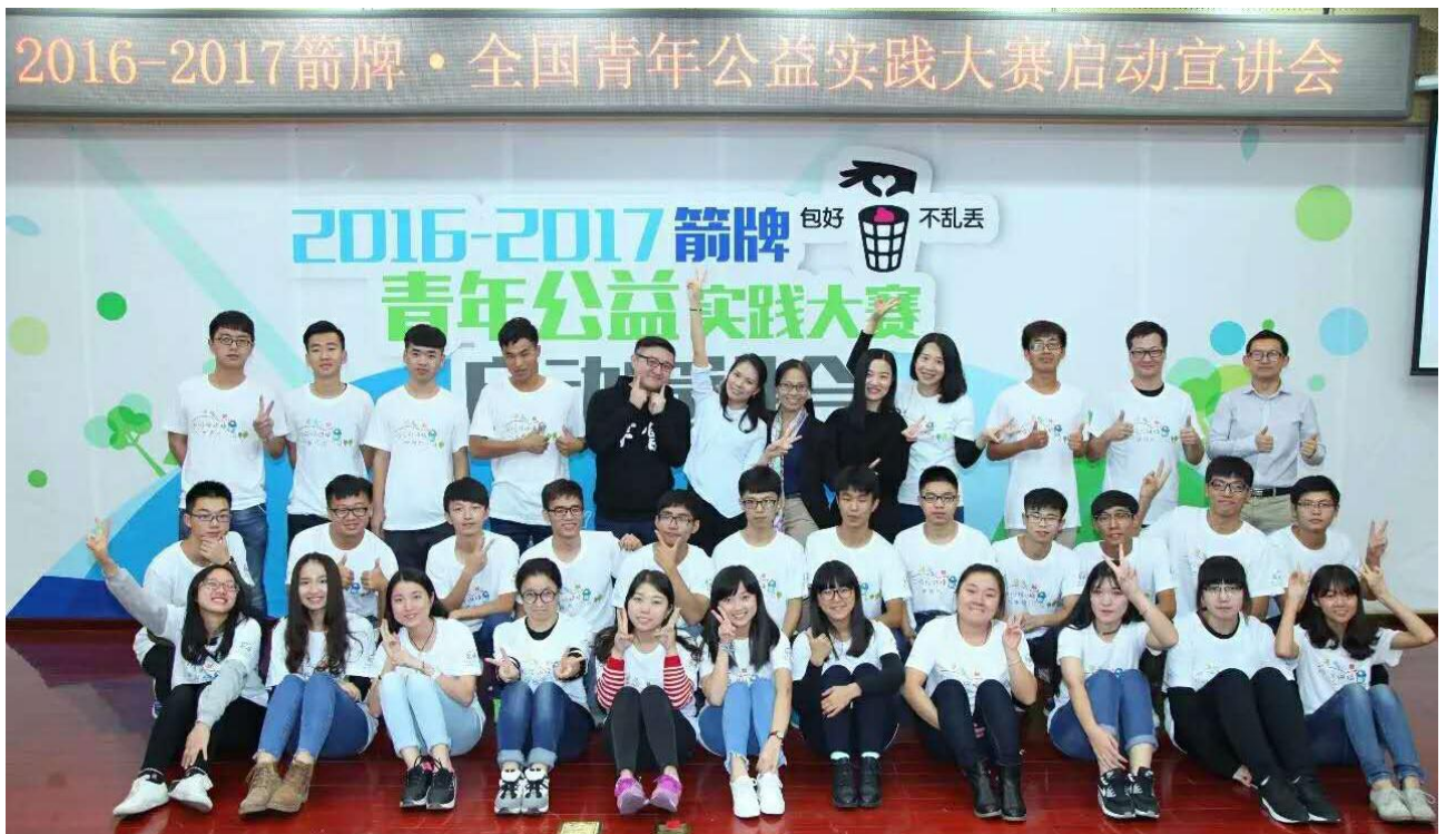
高校培訓會&項目啟動儀式