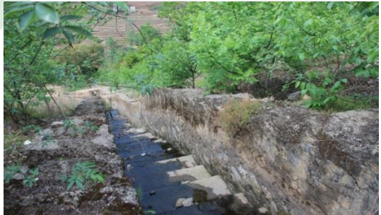
图七：乐红镇红布村小坝社 3 号溪桥项目调研