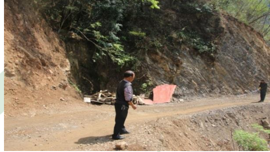
图五：乐红镇红布村小坝社 1 号溪桥项目调研