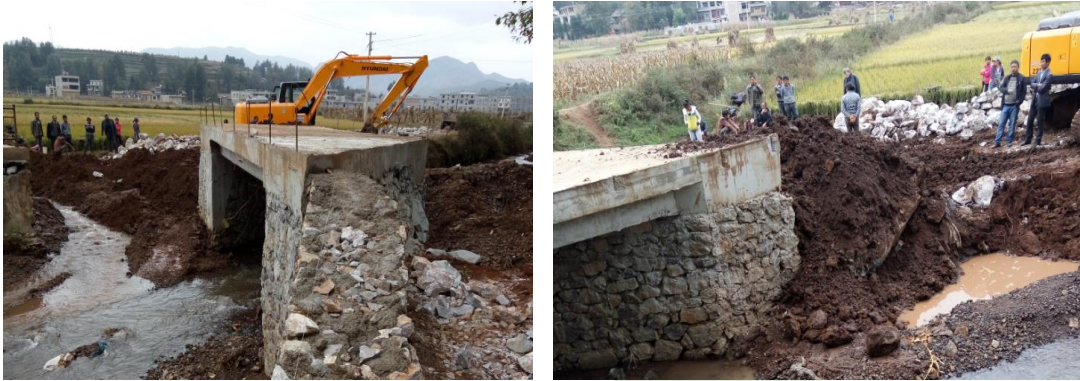
图二十九：龙树镇塘房村5社（金塘5社）爱心桥施工过半