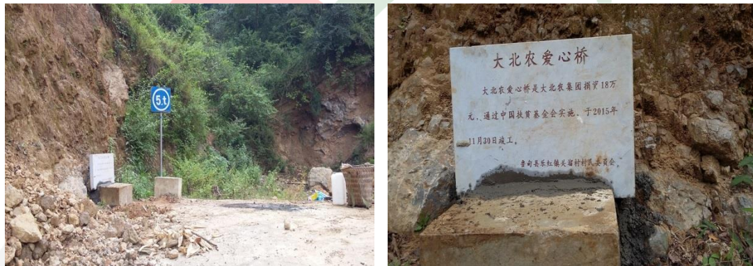
图三十五：乐红镇关溜村石丫口社爱心桥基本完工