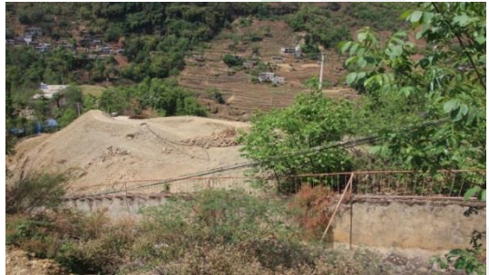
图六：乐红镇红布村小坝社 2 号溪桥项目调研