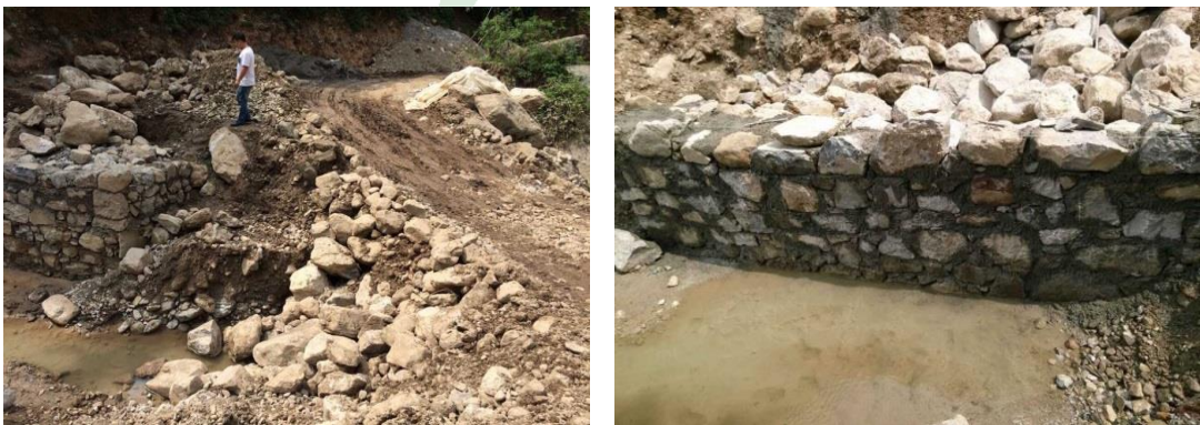
图三十一：乐红镇红布村谢家老包社爱心桥基础施工