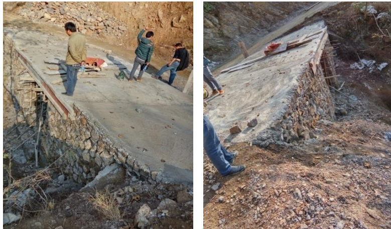
图十七：乐红镇红布村小坝1号施工过半