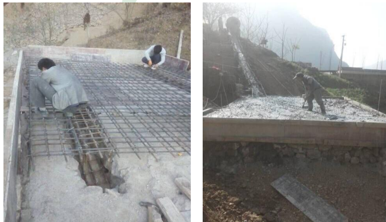
图十九：乐红镇红布村小坝社2号桥面布筋浇筑