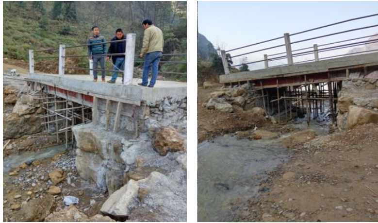
图十四：乐红镇红布村红岩脚社爱心桥基本完工