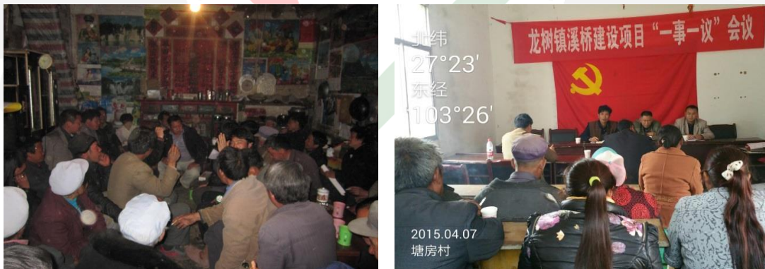
图十：大北农集团爱心桥项目启动说明会

每座桥的受益人数不少于100人，附近有学校的优先考虑；人行桥长度不少于8米，宽度不少于1.5米；车行桥长度不少于6米，宽度不少于2.5米；车行桥载重不小于5t；桥梁建成后保证至少能正常使用20年；溪桥援建资金不超过18万元/座。