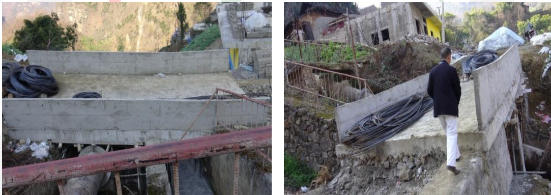
图二十四：乐红镇红布村小坝 3 号基本完工