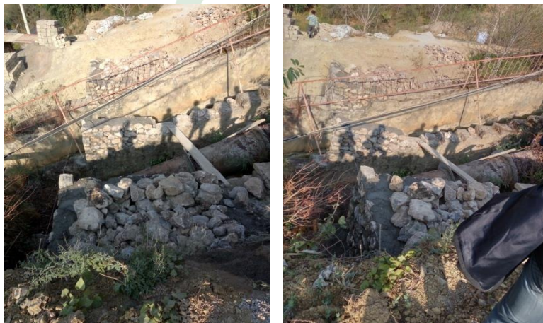
图二十二：乐红镇红布村小坝3号桩基施工