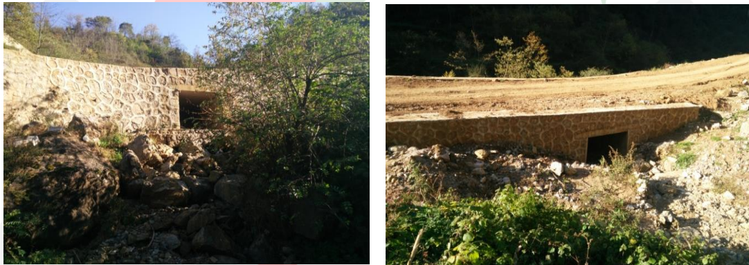
图二十七：乐红镇红布村大火地社主体基本完工