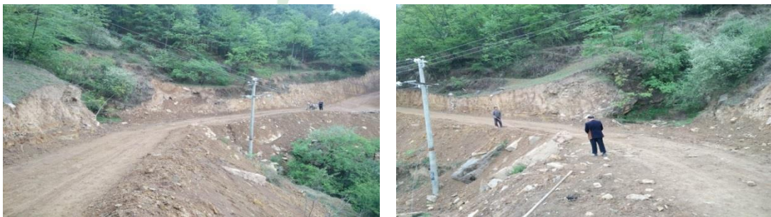
图三：乐红镇红布村谢家老包社溪桥项目调研