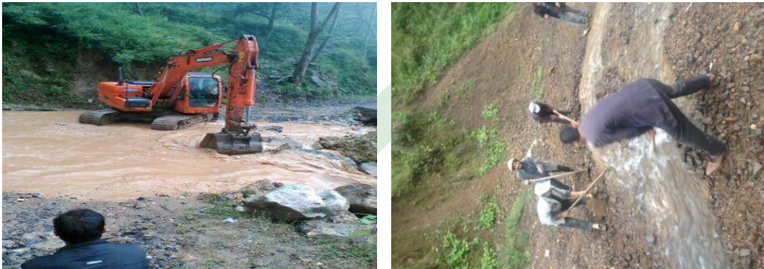
图十二：乐红镇红布村红岩脚社爱心桥开挖基坑