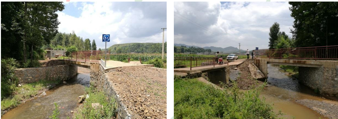
图三十：龙树镇塘房村5社（金塘5社）爱心桥主体完成