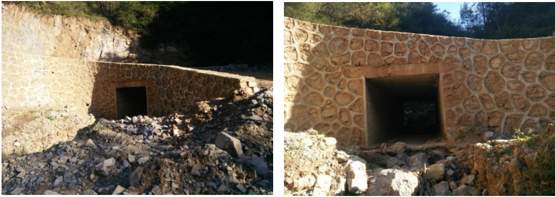
图三十二：乐红镇红布村谢家老包社爱心桥主体基本完工