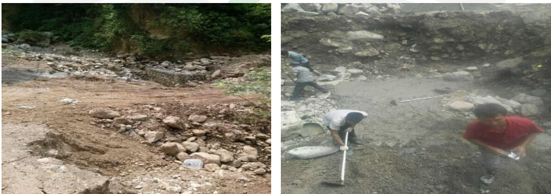
图三十三：乐红镇关溜村石丫口社爱心桥主体基本完工