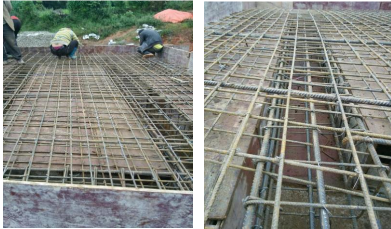
图二十六：乐红镇红布村大火地社桥面布筋浇筑