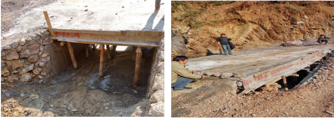
图二十：乐红镇红布村小坝2号进展过半