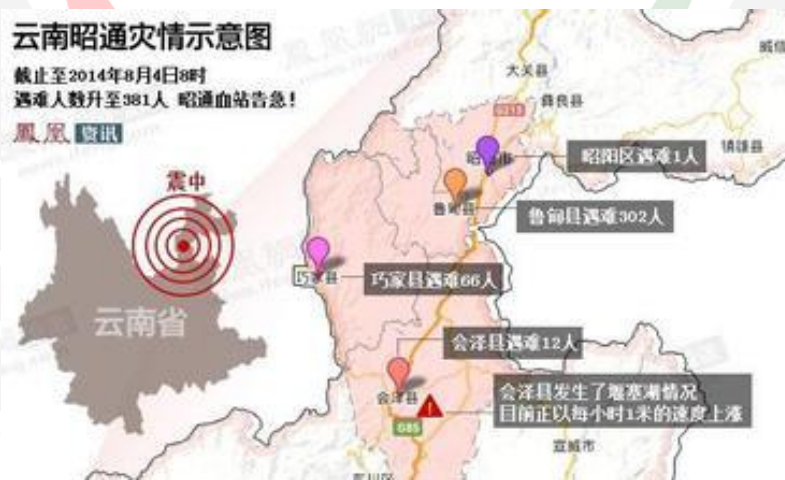
图一：“8.03”鲁甸地震影响区位图

“8.03”鲁甸地震发生后，除了给当地造成人员伤亡及财产损失外，地震也给当地社区原本较为薄弱的基础设施带来了重创，部分与群众日常出行，生活密切相关的便民桥遭到损坏。