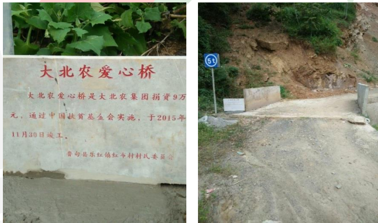
图二十一：乐红镇红布村小坝2号基本完工