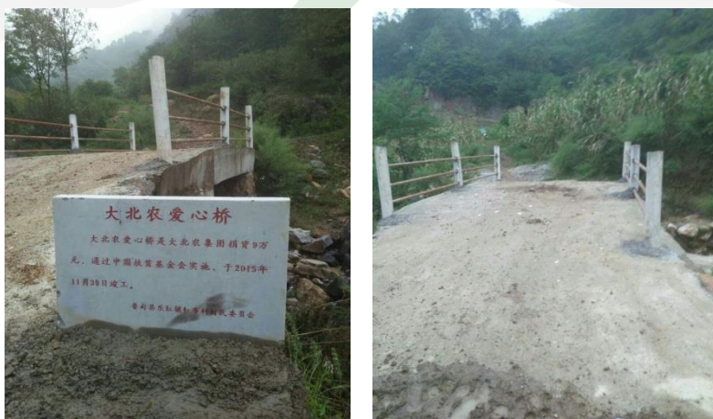
图二十八：乐红镇红布村大火地社主体已完工