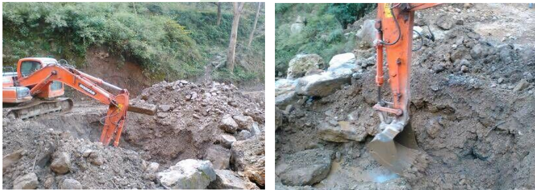
图二十五：乐红镇红布村大火地社开挖基坑