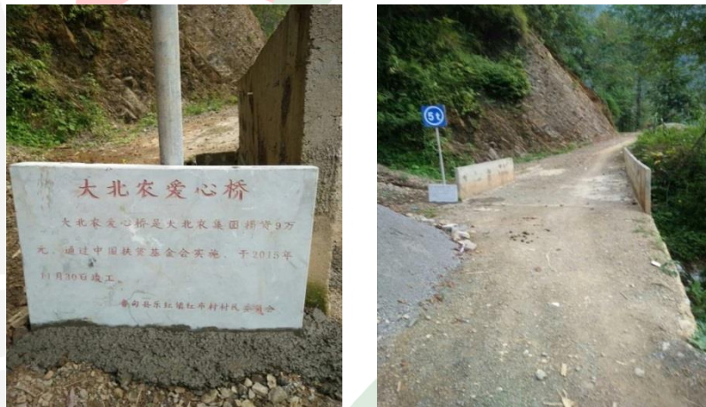
图十八：乐红镇红布村小坝1号基本完工