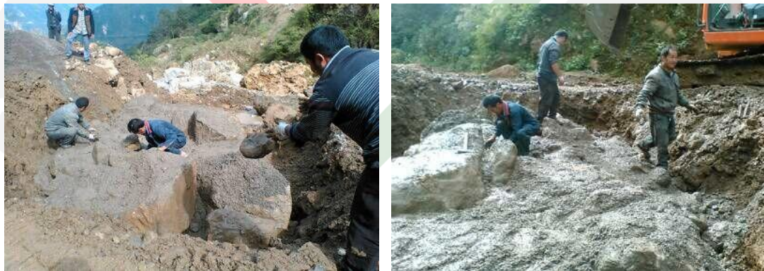
图十三：乐红镇红布村红岩脚社爱心桥支砌挡墙