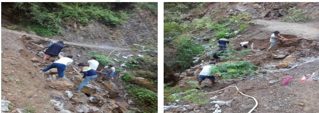
图十六：乐红镇红布村小坝社1号开挖基坑