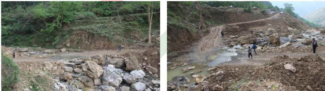
图二：乐红镇红布村红岩脚溪桥项目调研