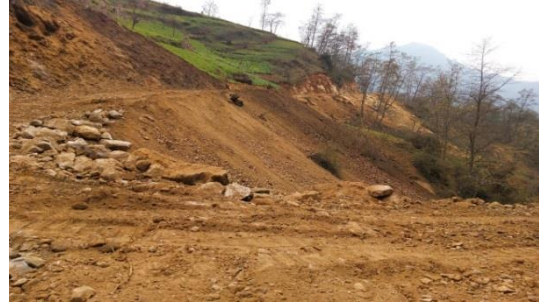
图四：乐红镇关溜村石丫口社溪桥项目调研