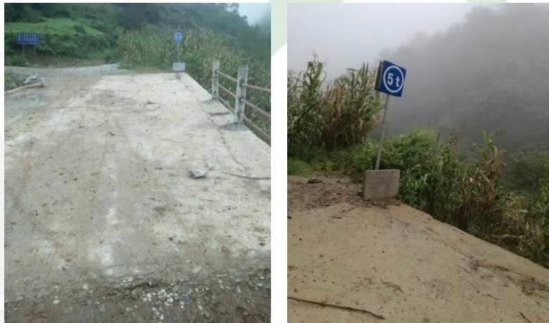
图三十二：乐红镇红布村谢家老包社爱心桥完工通车