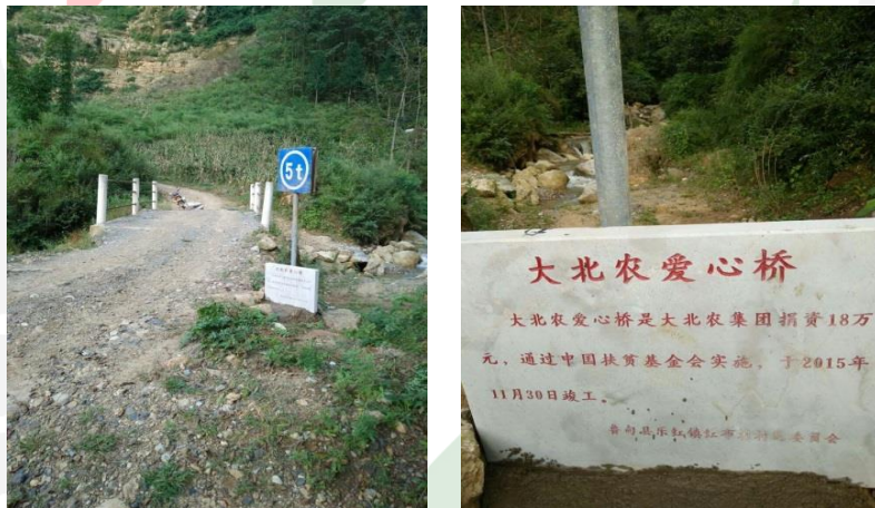
图十五：乐红镇红布村红岩脚社爱心桥完工