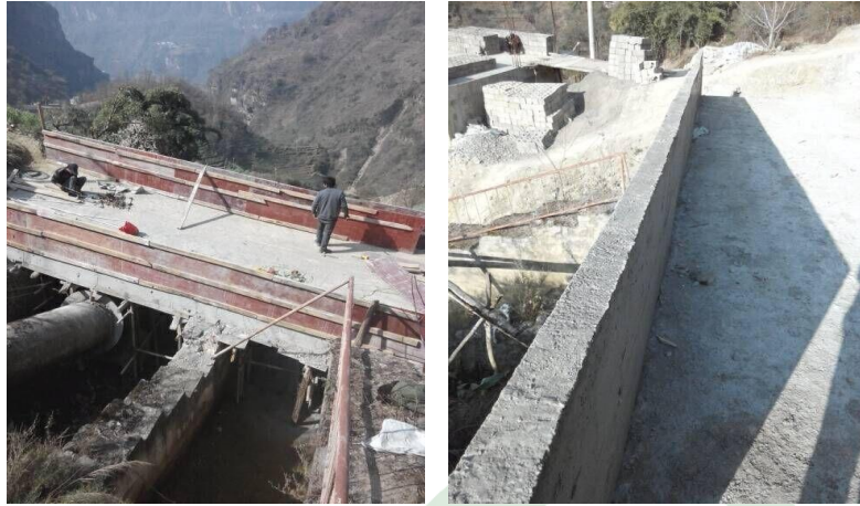
图二十三：乐红镇红布村小坝 3 号桥面布筋浇筑