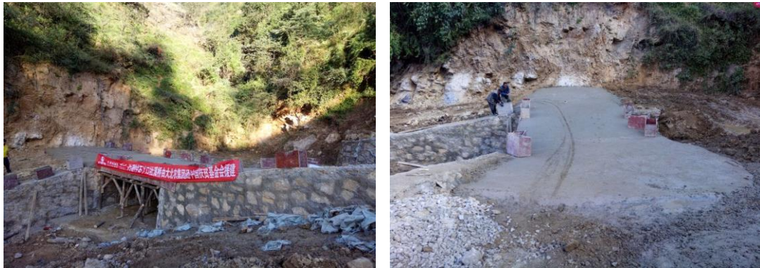
图三十四：乐红镇关溜村石丫口社爱心桥施工过半