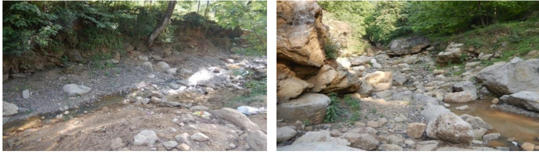
图九：乐红镇红布村大火地社溪桥项目调研