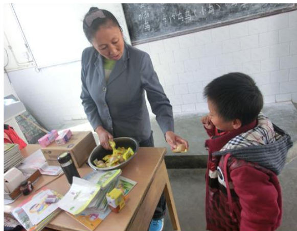
左图：学校老师在储藏室为各班级分发营养餐； 右图：各班级老师为学生们分发营养餐；