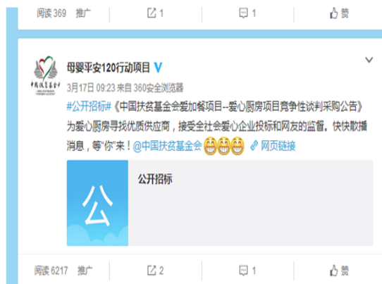
上图：在官网、招标网、基金会中心网等发布爱心厨房招标信息。