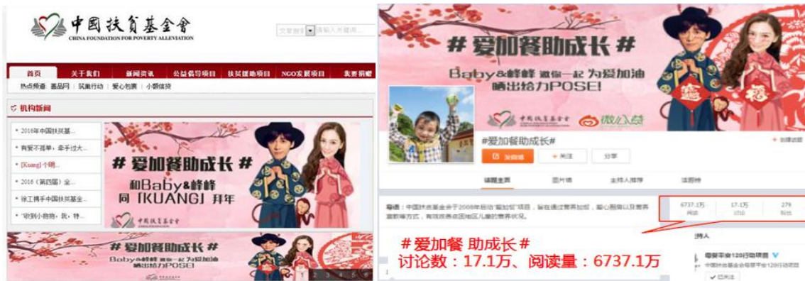
左图：在 CFPA 官网首页推送活动信息； 右图：活动开设微博话题，吸引超过 17 万公众参与。

餐助成长#话题阅读量超过 6700 万，吸引 17 万网友参与讨论；微博以及微信端累计筹款超过 18 万元。