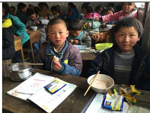
左图：学生们喝桂格燕麦乳；右图：早上，学生们吃着营养“桂格燕麦片”和鸡蛋。