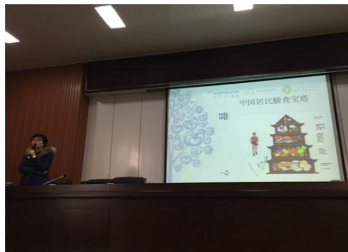
左图：制作的项目管理手册；右图：营养专家为参会老师、厨师等人开展营养知识讲座。