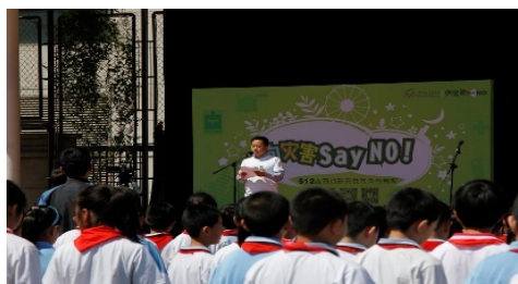
全国启动仪式（北京前门小学）

向灾害 SAY NO——512 全国减防灾社区公益活动全国启动仪式 执行机构：中国扶贫基金会 平安星减灾中心