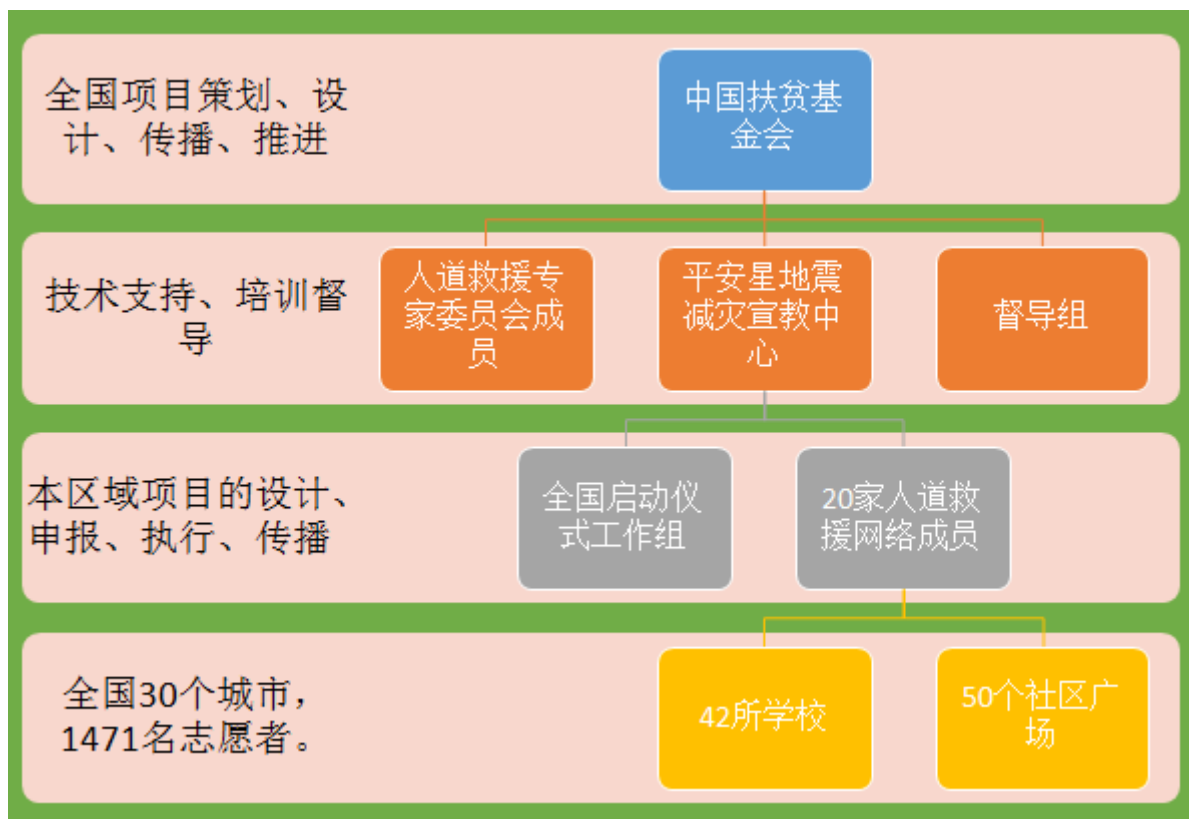
图 1：项目实施组织结构图

1. 中国扶贫基金会：负责项目的整体设计和管理；对接专业支持机构和相关专家，研发项目核心内容；搭建 NGO 网络，执行项目；开展项目传播与反馈。