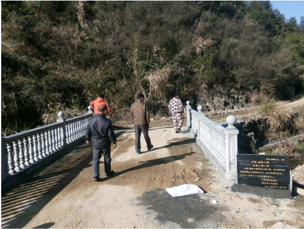
江西省修水县昆家山爱心桥竣工投入使用