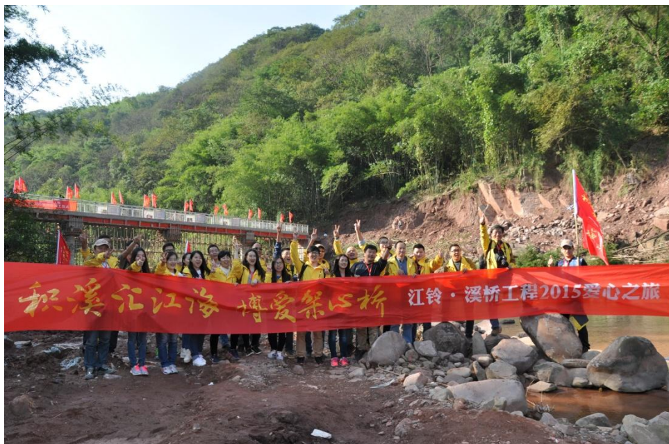
江铃溪桥工程第230座桥 圆“摆渡爷爷”的建桥梦