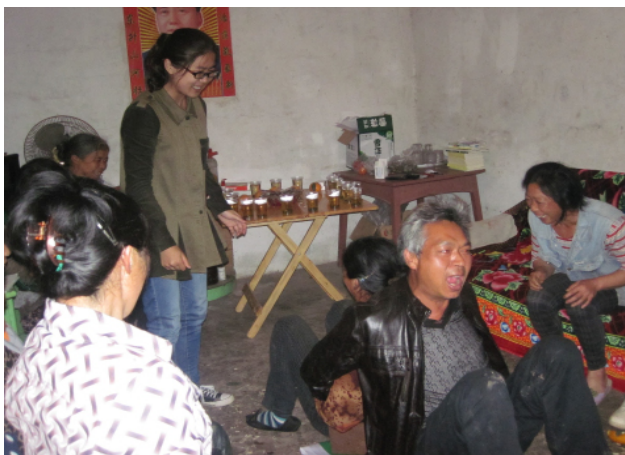
图 1：茶话会团建游戏