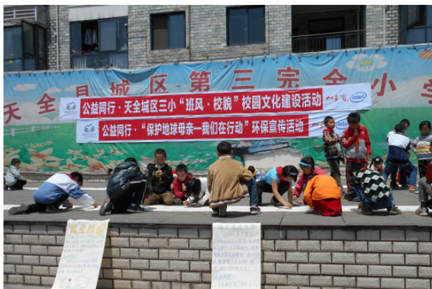
图 1: 环保宣导活动