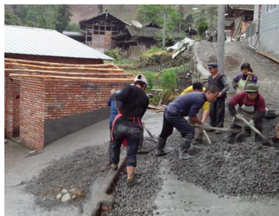
图 2：搅拌水泥铺平场地