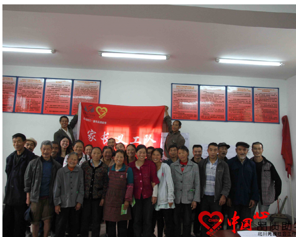
图 1：“家长义工队”开展培训交流

“美丽家园·梦想公益金”活动方案进行筛选，活动延续4月19日孩子们自发成立的小组，以美丽家园为背景，围绕着公益主题，针对在1000元的活动经费内策划的小活动展开深入的讨论。讨论环节结束后，10个小组依次上台进行分享。在经过无记名投票后，《关爱空巢老人》、《美化身边环境》、《帮助弱小儿童》、《关心留守老人》四个公益活动方案获得投票数的前四名。