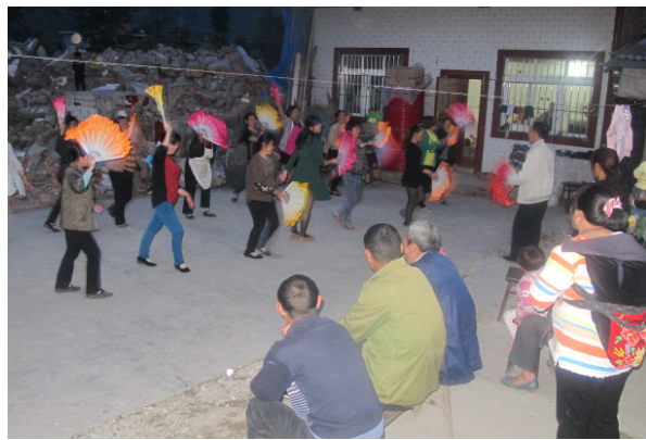
图 2：我们都爱看花灯