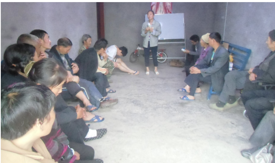
图 1：村民参加魔芋出苗管理培训

5月26日到28日，项目工作人员参加由尚明公益和成都大地社区主办的第二期沙龙。6月3日，项目社工联系了种子供应商的技术人员给村民进行魔芋出苗管理培训，村民来了20多人，主要培训的是出苗时需要注意的事项，特别是给魔芋打药的注意点及平时管理方面的细节。