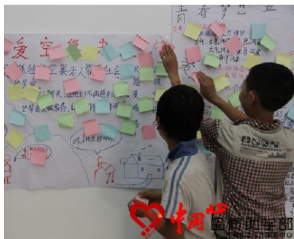
图 2：同学们为“美丽家园·梦想公益金”活动方案投票