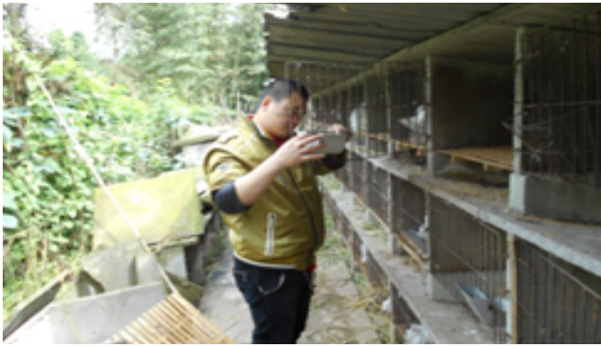
图 1：帮助村民整理兔圈