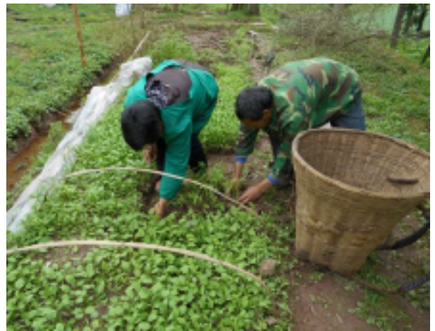
图 2：农户正在移种青椒苗