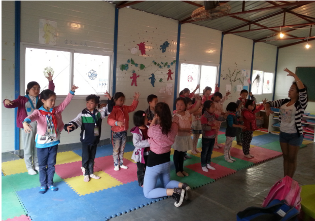
图 1: 为孩子们开展舞蹈培训