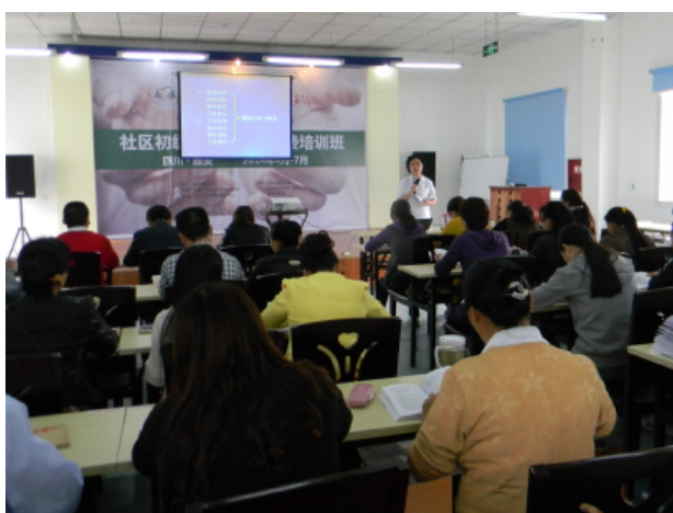
图 1: 培训班开班啦

鹤童学校“社区初级养老护理员免费培训班”开班仪式在雅安市名山区社会福利服务中心举行。开班仪式后，为期 10 天的培训班正式开始。培训期间，四川大学唐艳老师一行二人到培训现场进行项目指导。