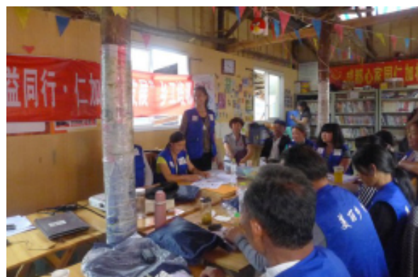
图 2：走访成都心家园社会工作服务中心