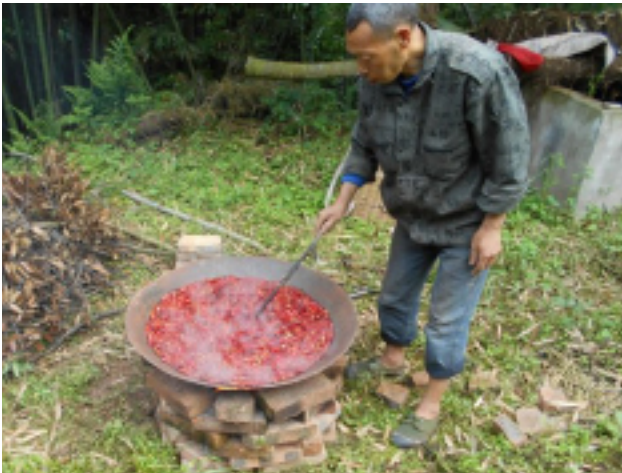
图 1：用朝天椒制作无公害土农药