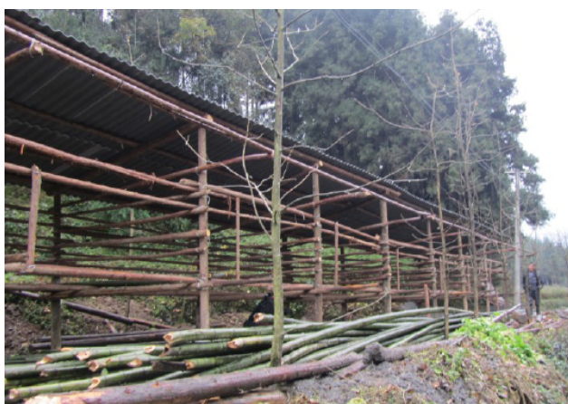
图 1：合作社修建新圈舍

合作社产品进展方面，益众针对合作社农产品进行专门的包装设计，提高产品的宣传效果，帮助农户把农产品推销向市场。合作社农产品直营店装修，为了更好的配合合作社产品宣传推广和市场对接，益众拟在雅安市社会组织和志愿者服务中心设立一个农产品直营店，以展示合作社优质农产品，目前直营店正在装修中。