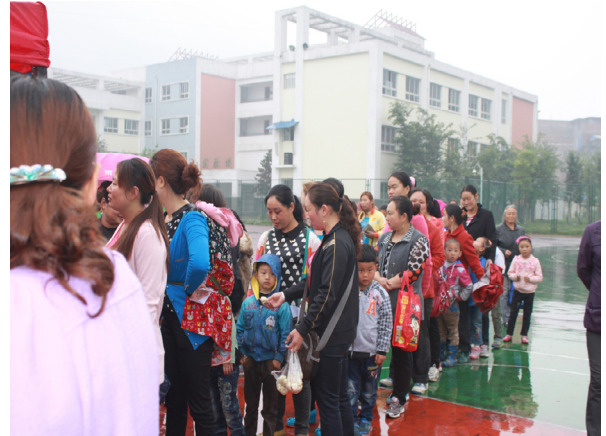
图 2: 母亲和孩子们领节日礼物