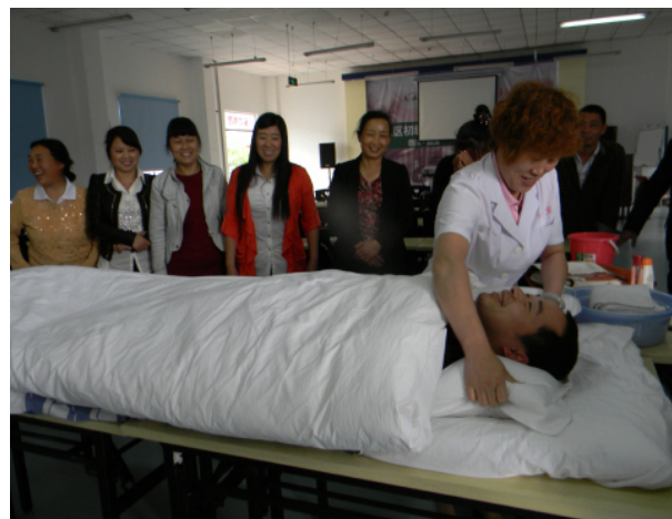
图 2: 仔细观摩护理细节