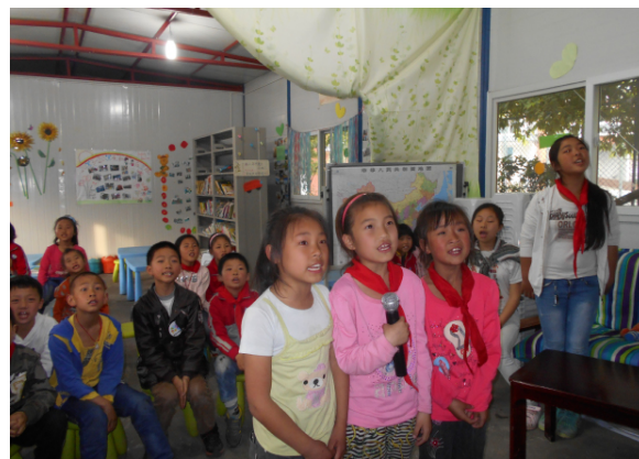
图 2: 校园小歌手进行时