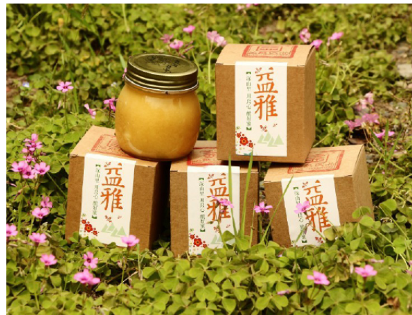
图 2：合作社产品穿新衣