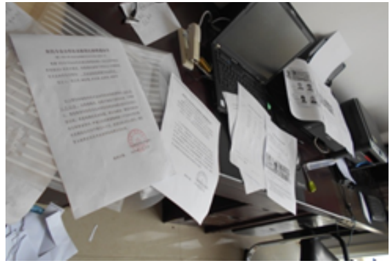
图 2：注册合作社时的手续资料