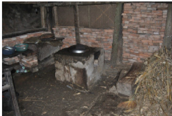
图 2：村中老人屋内一角