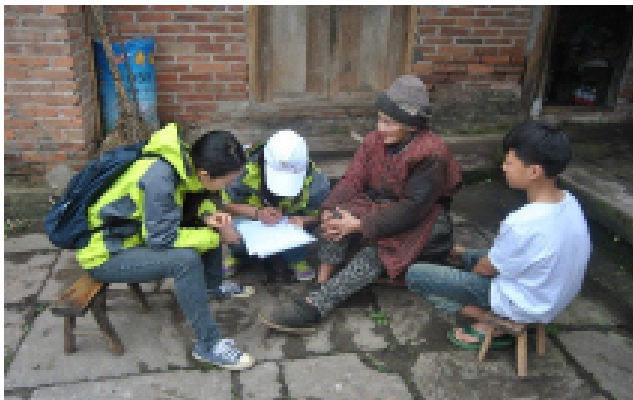
图 1：走访记录村中老人情况

梳理老协职责、功能，陪同老协成员对特殊老人进行走访、开展特殊老人护理，对村老人建立健康档案，提供基础健康养老及护理知识学习。