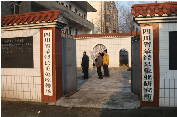
图 3: 荣经县兔场考察