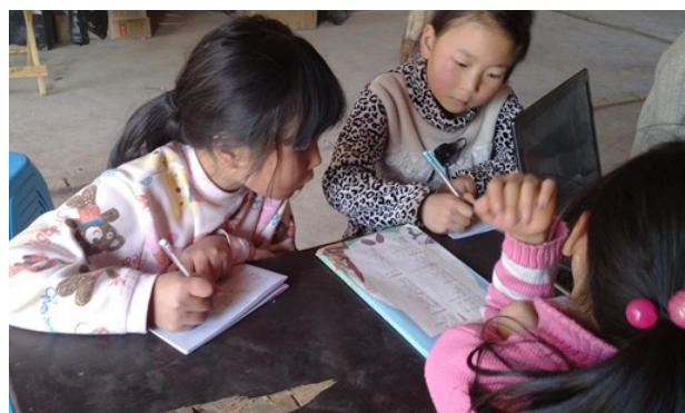
图 2: 孩子们在认真地上课、写作业