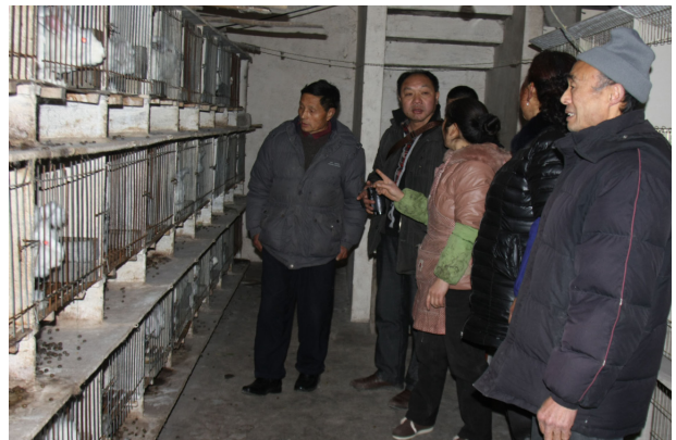
图 4: 考察新型兔舍