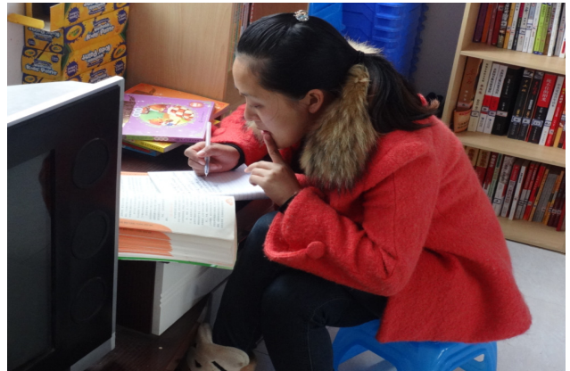
图 2: 社工在认真学习

“公益同行”之改变自我、改变乡村、改变中国的路上需要 NGO 团队与乡村结伴而行，这种“结伴同行”是对参与式扶贫模式的很好诠释，这个过程中不仅需要 NGO 团队工作人员能够积极投入到改变乡村的实践当中，同时也需要工作人员在工作中不断进行自我反思和自我总结，只有工作人员实现了自我改变，才能真正为乡村的改变奉献力量。