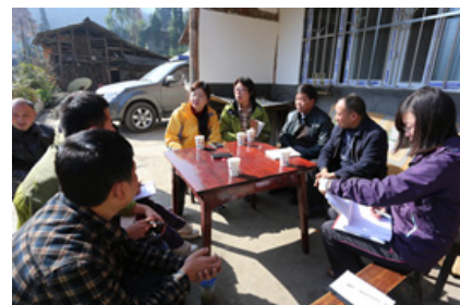
图3：实地走访项目区，深入了解项目情况

经过前期项目申请、项目初审、专家评审、实地调研、沟通调整等一系列工作，“公益同行——NGO合作社区发展计划”最终确定芦山灾区16个项目获得2014年度项目支持，同时也确定了2014年度“公益同行·助力工坊”“公益同行·分享沙龙”“公益同行·监测评估”“公益同行·雅安乡工计划”等助力成长计划的服务方案。期间，将有来自于北京师范大学、四川大学中国西部反贫困研究中心、四川尚明公益发展研究中心等多家专业机构的专家团队共同携手助力社会组织成长。