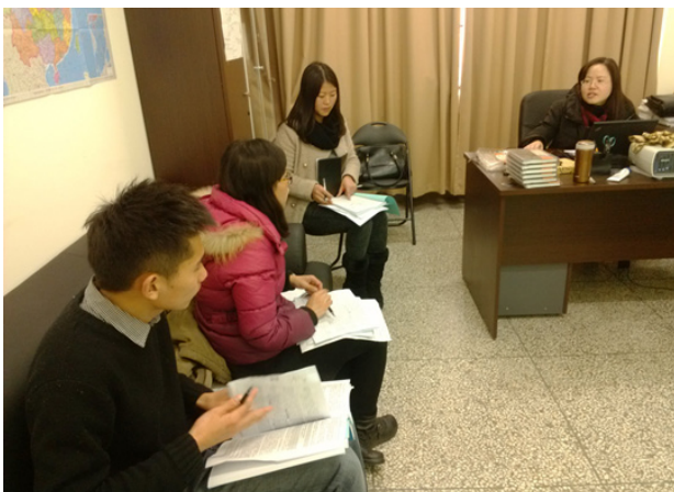
图 1: 王卓教授携团队成员就基线评估工作安排开会讨论

“公益同行”之改变自我、改变乡村、改变中国的路上需要 NGO 团队与乡村结伴而行，这种“结伴同行”是对参与式扶贫模式的很好诠释，这个过程中不仅需要 NGO 团队工作人员能够积极投入到改变乡村的实践当中，同时也需要工作人员在工作中不断进行自我反思和自我总结，只有工作人员实现了自我改变，才能真正为乡村的改变奉献力量。