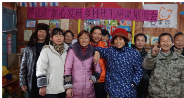
图 2: 座谈会结束留影