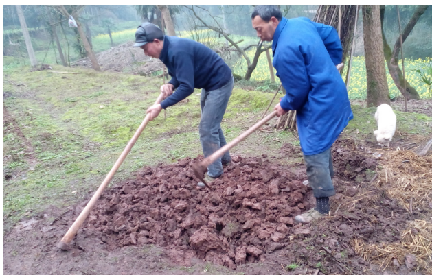
图 2: 育苗整土