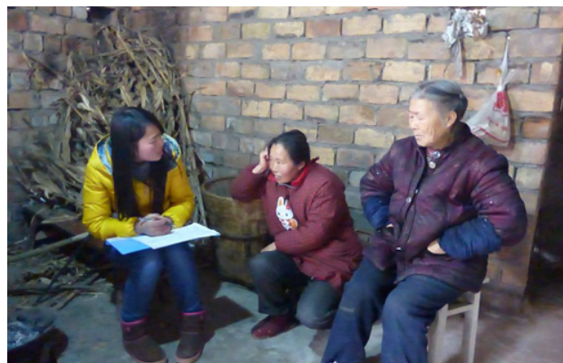
图 2: 工作人员进行家访