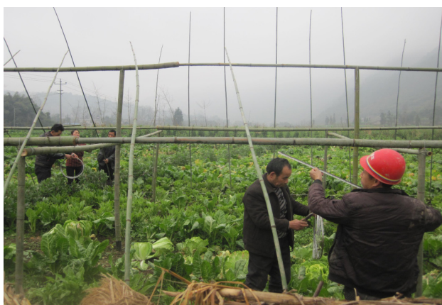
图 1: 合作社成员在搭建大棚

前期评估调研工作、合作社成员前期组建工作已完成，并与芦山县农业局、芦山县农工办、飞仙关政府和芦山县三友村等各部门和单位取得政策、技术和场地支持。同时，合作社成员用于大棚建设的材料已筹备齐全。现阶段，慈卫社工正组织协调合作社成员开展大棚建设工作，确保大棚建设中的安全问题及项目进度。期间召开大棚建设筹备会议一次，召开合作社社员大会一次，组织合作社成员至周边大棚蔬菜种植基地参观一次。