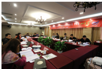
图2：“公益同行——NGO合作社区发展计划”项目评审会，28家参评机构逐一答辩。