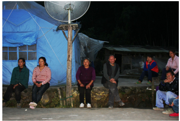
图 2: 村民的茫然