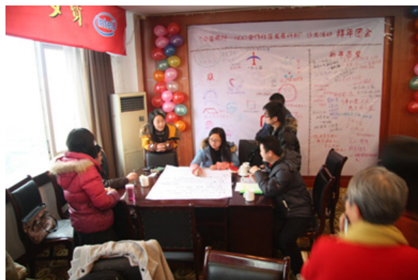
“公益同行——NGO合作社区发展计划”资助项目统计表