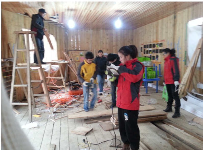
齐心协力，共同参与，把“宝贝心立方”小木屋重装得更加温暖美观