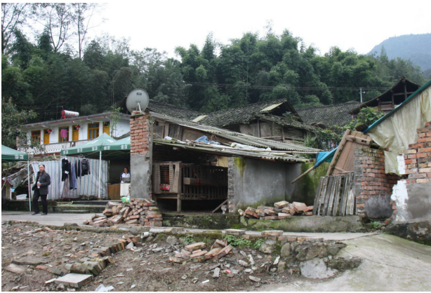
图 1: 被地震摧毁的溪口村一角