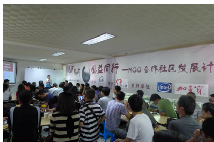
图1：“公益同行——NGO合作社区发展计划”项目宣讲会在雅安举行

2013年，中国扶贫基金会与加多宝集团和英特尔（中国）有限公司共同投入2500万元（其中包括加多宝1亿元捐赠善款中的1000万元和英特尔为4·20芦山地震灾区捐赠的1000万元），携手打造“公益同行——NGO合作社区发展计划”，从社区项目支持、社区能力陪伴、社区人才培养三个层面系统性地支持社会组织，活化社区服务、激发社区活力，致力于激发、凝聚社区创造力和行动力，提出了“改变自我、改变乡村、改变中国”的合作发展理念，探索“中国农村社会治理创新中的社会组织参与机制”及“新时期农村社区综合发展模式”，推动社区产生积极的、可持续的改变！