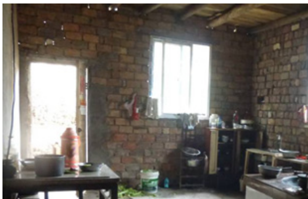
图 1: 处于困境的家庭

前期调研阶段，项目社工先后对项目所涉及的中里镇7个村，上里镇9个村共计95名学生开展家访工作。2月22日至25日，项目社工先后与中里镇和上里镇16个行政村共计19名村干部取得联系，向各村村干部核实了已经家访的学生的信息，并与村干部协商了继续推荐符合条件的学生。截止到2月28日，累计完成家访92名学生，形成92份家访报告，电话访问学生3名。其中，68名学生符合资助标准，14名学生待进一步完善材料和核实信息，13名学生不符合受助标准，项目社工于2月28日将家访结果反馈至四所学校，并沟通了下一步协调会的准备工作。