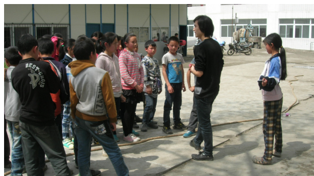
老师带领学生做游戏