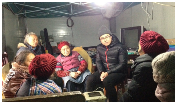
图 2: 黎明村老年协会议事会