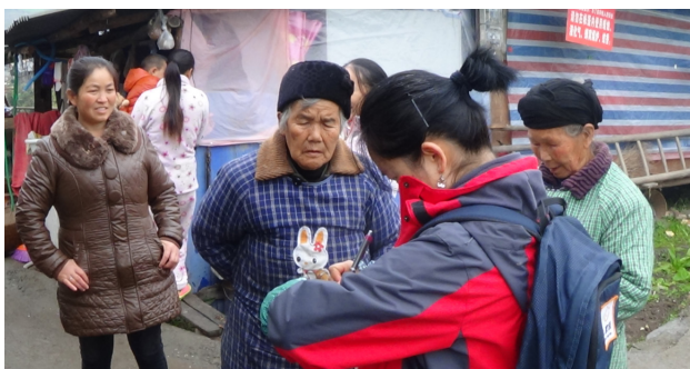
图 1: 前期社区走访—招募乡村社工

前期主要面向仁加村、大同村做了集中式访谈，入户调研，就关于乡村社工培训的话题以及村民的其他需求做了深入了解与记录。对 13 名有意向从事乡村社工的村民进行了座谈交流会，最终有 6 名村民确定愿意从事后期的乡村社工建设。2 月份，对有意向从事乡村社工的社区领袖进行了深入交流与访谈，对 2014 年的工作双方交换了计划，并达成了一致；另外，还面向整个清仁乡招募返乡青年、留守妇女、在家待业的村民加入乡村社工培育计划，5 商定了 3 月份进行首次工作培训。