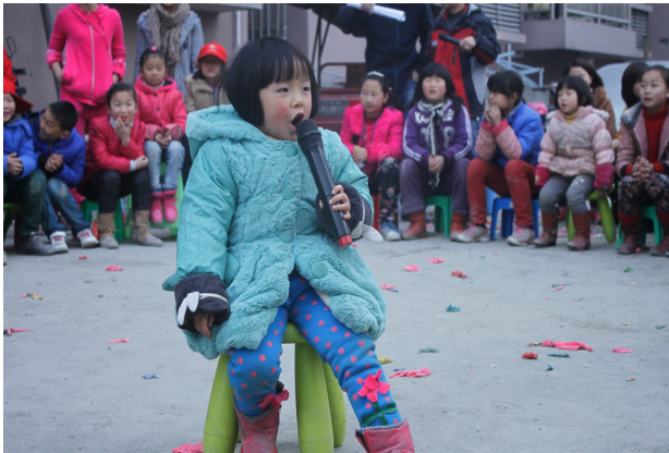
图 1: 我是歌手

关于留守妇女。可以说是“一箭双雕”，一则解决了工作问题，就近务工既可以照顾家庭，又可以学习新知识；二则增加了人际交流的机会，拓宽了自我视线范围，对稳定社区环境、保证“三留人员”不被二次伤害，都有着积极作用。