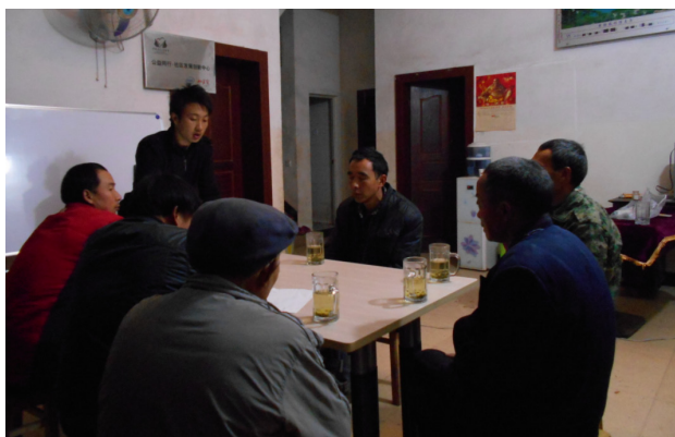
图 1: 土地植物会议

调研评估会及农村生态家庭征集报名：2月底邀请村民一起做了我们调研数据的分享以及进一步对村民的需求分析，了解村民参与农场建设的意愿及难处，最终6户农户自愿报名参与城乡合作农场项目。