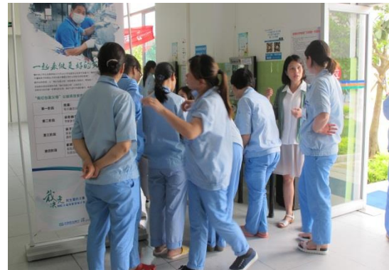
企业饭堂现场宣传招募