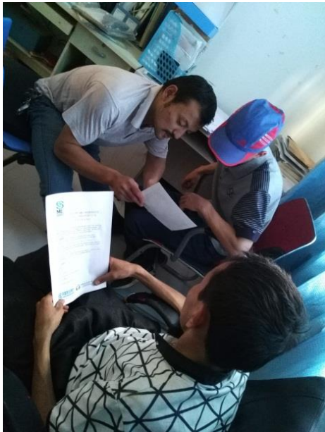
向项目执行人员了解具体培训事宜