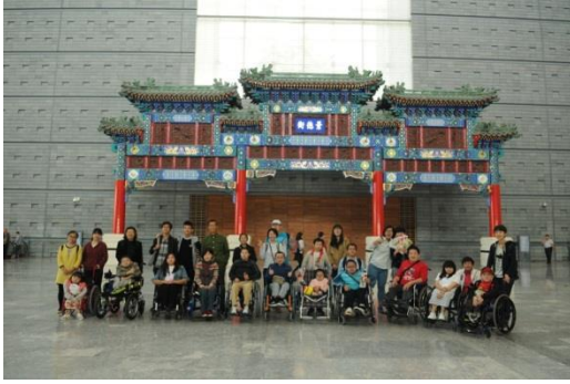
自立生活课程学员外出