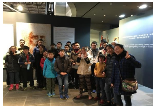
WABC 部分学员在“天才达芬奇”画展上合影留念