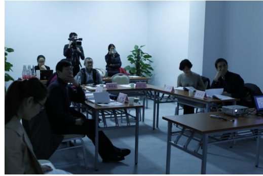
答辩会特邀专家组