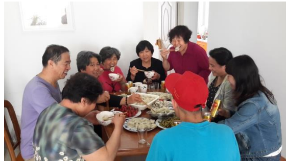
志愿者入户一起包饺子