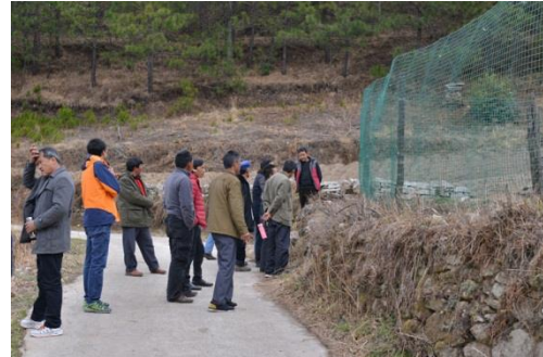
参会代表在河源参观股份制项目