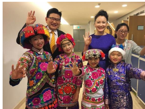
宋基金会 30 周年庆典活动