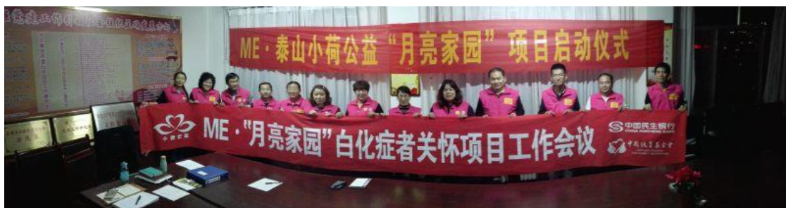
“月亮家园”白化症者关怀项目工作会议

目前进展： 组织“ME·月亮家园”工作会议及培训课程，“ME·月亮家园”志愿者工作证、统一马甲、臂贴、项目条幅等物料已设计完成并制作中；“月亮悄悄话”心理热线即将为白化症者服务。