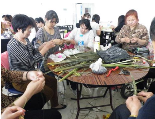
老学员认真地做草编制作

目前进展： 招募学员 50 余名并开展了两期培训，其中 10 名掌握了中高级技术，10 名掌握了初级技术。