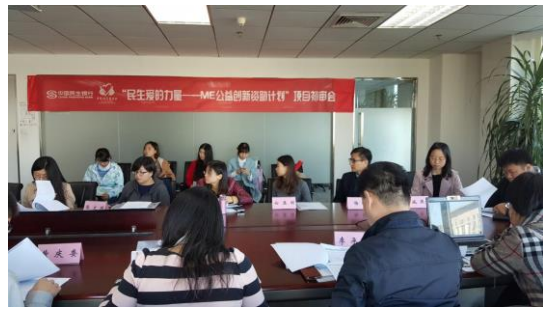
专家组对项目进行评议