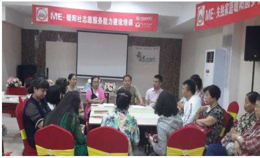
暖阳社-ME-志愿服务能力建设培训