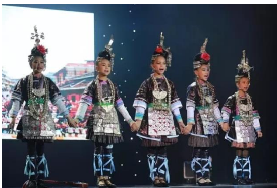
小黄小学学生上海才艺演出

目前进展： 项目人员走访了沧源民小；三台小学、益哇小学、县华小学共计 10 名师生先后到上海才艺交流互动。