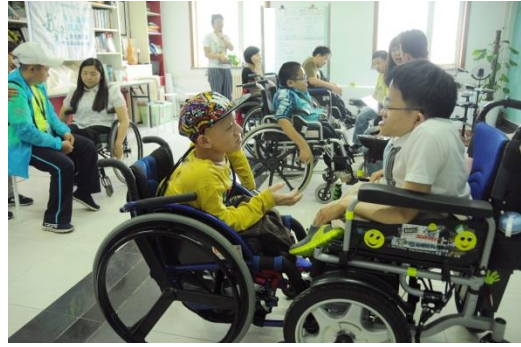
自立生活课程学员互相交流