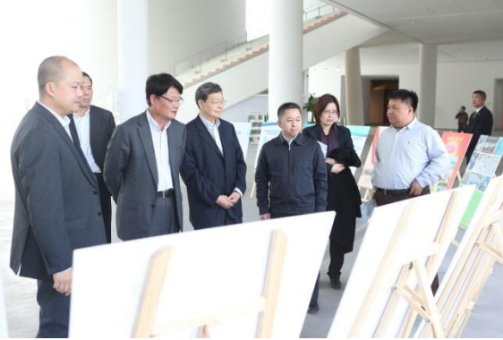
与会领导参观 ME 项目展

共同为在 ME 公益创新资助计划中获选的 20 位公益组织代表颁发 ME 公益创新资助基金，标志着首批 ME 资助项目正式启动。