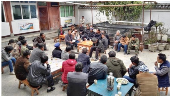
以前项目点的普通村民与大家分享经验

目前进展： 组织了村民到其他项目点交流；项目人员深入走访社区，前往各村民小组组织村民会议，详细介绍项目内容。