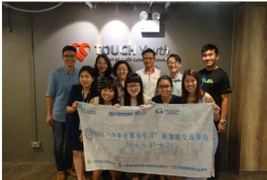
核心团队赴新加坡学习