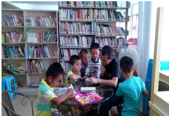
社区儿童阅读服务-与爸爸一起阅读

目前进展： 完成 4 家企业的走访、合作洽谈，确定 3 家签署合作备忘录，招募 137 名员工；对 3 家企业的 12 名父母工人、基层管理者一对一访谈；亲职教育培训课程内容设计完成 75%；持续开展社区托管服务，服务孩子阅读、文体玩具使用 610 人次。